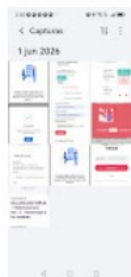
WhatsApp Image 2026-06-01 at 3.51.05 PM.jpeg 58K

anexo imagen de los pasos para inscribir al gruposolrespladeciente en danza categoria 2 adulto mayor teatro villamayor pero noha sido posible despues de termino de inscribir los integrantes me devuelve al inicio