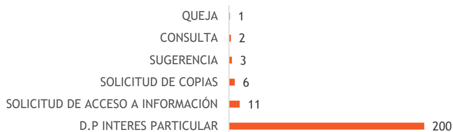
Gráfica No. 3 Tipo de peticiones

Solicitud de Copias: Se registraron 6, representando el 2.7% del total de peticiones. Este tipo de solicitud, aunque menos frecuente, sigue siendo una necesidad para ciertos ciudadanos que requieren documentación específica. Sugerencias: Se recibieron 3 sugerencias, constituyendo el 1.3% del total. Las sugerencias son valiosas para mejorar nuestros servicios y