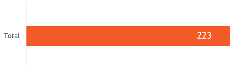
Gráfica No. 1 Total peticiones recibidas

En el mes de mayo, el número total de peticiones recibidas fue de 223, lo que representa una disminución significativa en comparación con el mes anterior. En abril, se registraron 293 peticiones, lo que implica una reducción de 70 peticiones en el mes de mayo. Esta caída del 23.89% sugiere una mejora en la eficiencia de nuestros procesos, toda vez que a través de nuestros canales de atención se brinda una respuesta inmediata, lo que evita tener que interponer un derecho de petición, esta estrategia de gestión, promueve una mejor resolución de problemas, en las necesidades de la ciudadanía. Continuaremos monitoreando de cerca estos datos para asegurar que mantenemos un alto nivel de atención y respuesta a las peticiones de la ciudadanía.